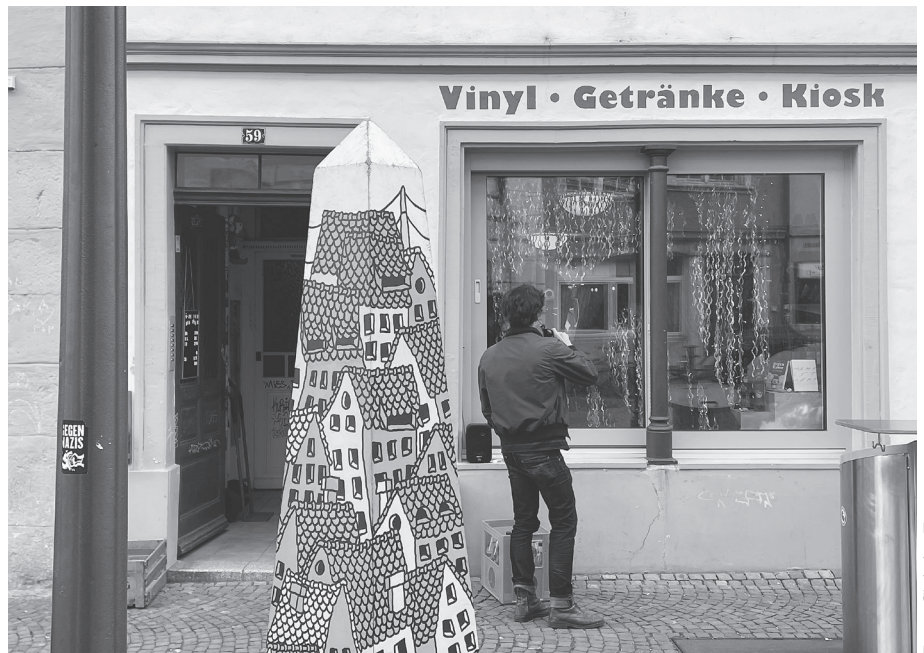
Frontansicht vom «Halt de Lade» und rechts davor der meistfrequentierte Niederflurcontainer der Altstadt.

Zehn Jahre, eine Pandemie und viele kleine Umbauten später läuft der «Halt de Lade» besser denn je: Im Inneren gibt's ein reichhaltiges Angebot an Tonträgern (Vinyl, Kassetten), Bandshirts, Getränken und diversen Tabak-, Knabber- sowie Esswaren und draussen versammeln sich in kalten Zeiten etwas weniger und in wärmeren Zeiten zahlreichere Leute aus der Nachbarschaft zum feierabendlichen Umtrunk rund um den wohl belebtesten Niederflurcontainer der Stadt. Die Anwesenden öffnen dann jeweils pflichtbewusst die Müllklappe, wenn jemand