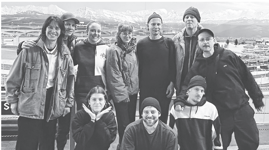
Die «Halt de Lade»-Crew.

Ein Sprachspiel führte damals zum eigenartigen Namen des Neustadt-Ladens, nämlich die Antwort auf die Frage «Was für en Lade?»: «Halt de Lade.» (Der Name meint also «Eben dieser Laden», ist also keine gleichbedeutende Redewendung von «Halt die Klappe»).